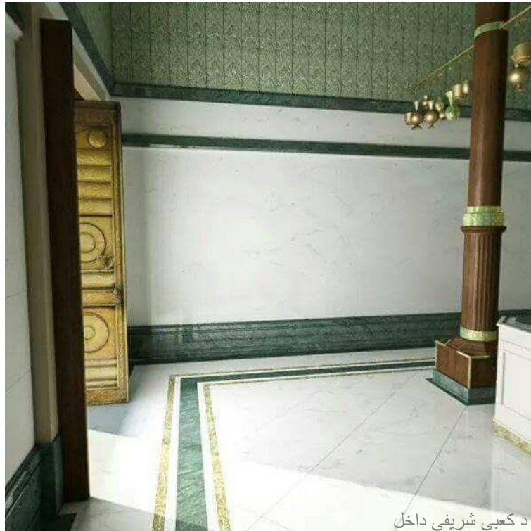
د کعبې شريفې داخل

يادونه: د حج او عمرې د تفصيلي معلوماتو او مسائلو لپاره " د حج ښه ملگري " کتاب د تعليم الاسلام ويب پاڼي څخه ترلاسه کړئ.